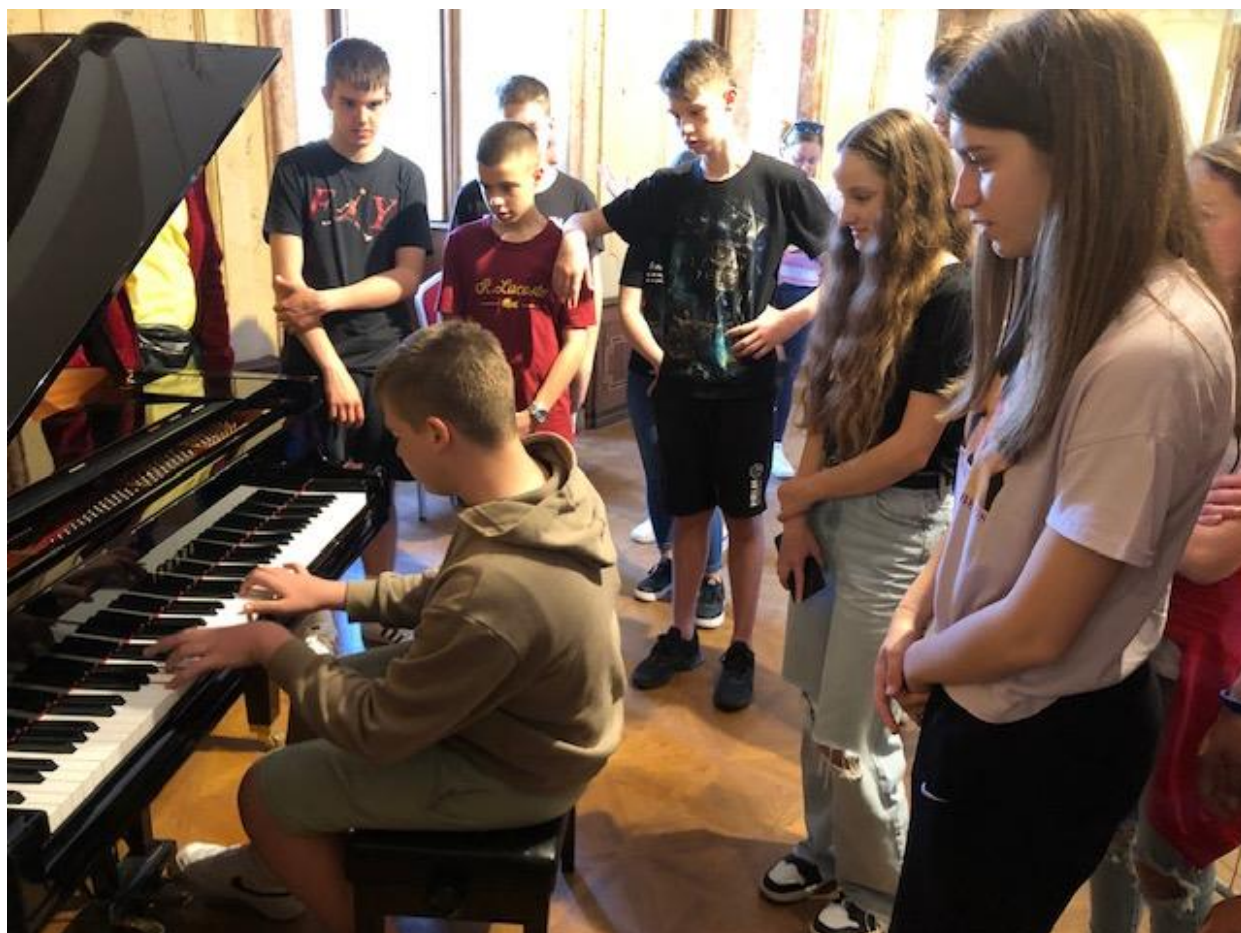
Malo smo i zasvirali