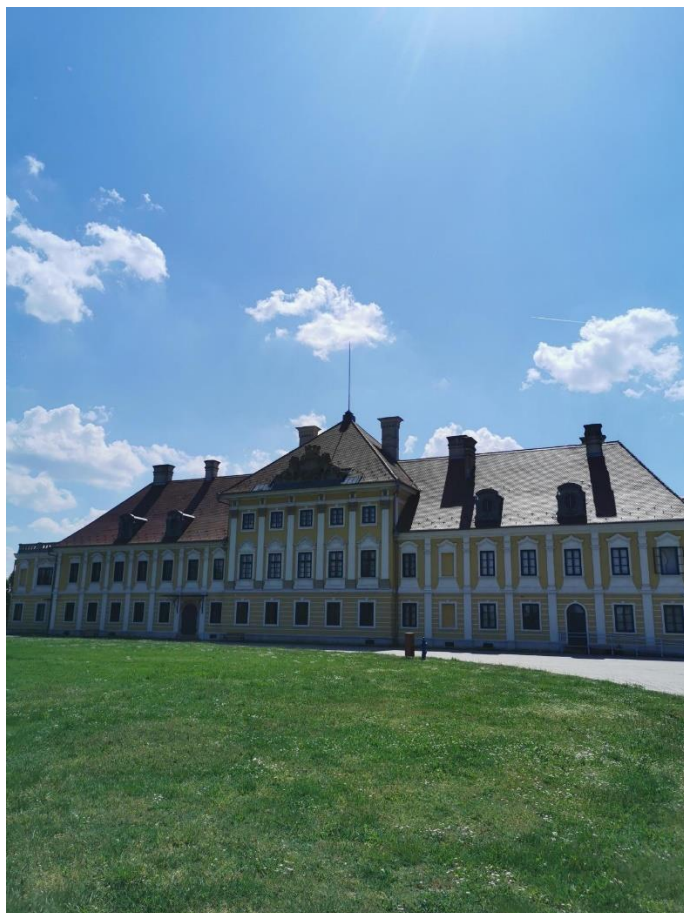
Dvorac Eltz – Gradski muzej Vukovar (dašak raskošnih vremena)