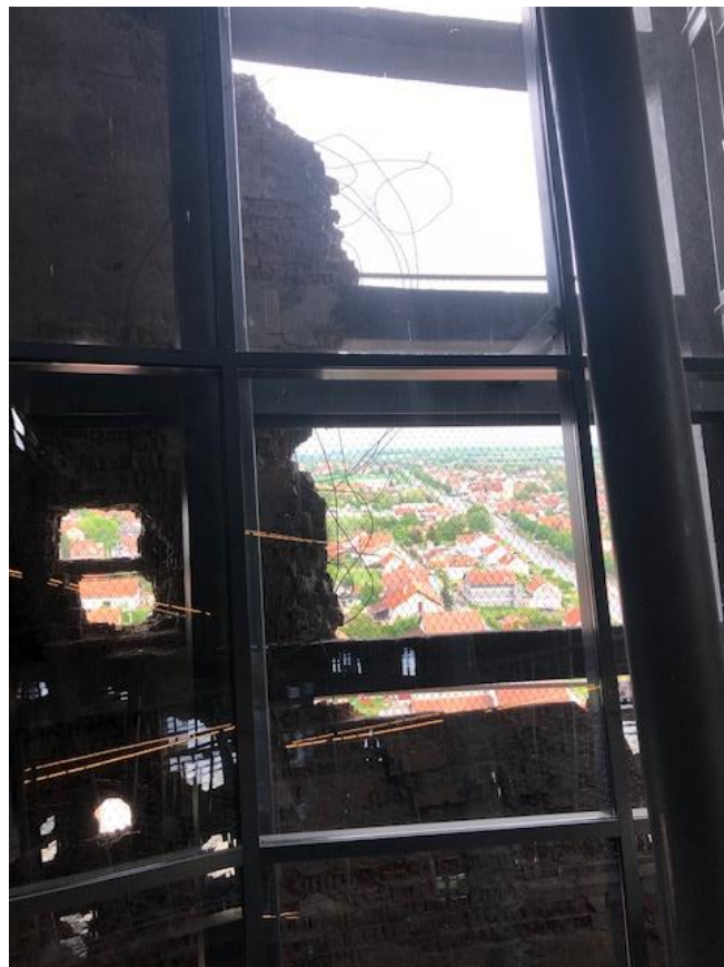
Fascinanta unutrašnjost Vodotornja i njegov muzeološki interaktivni postav