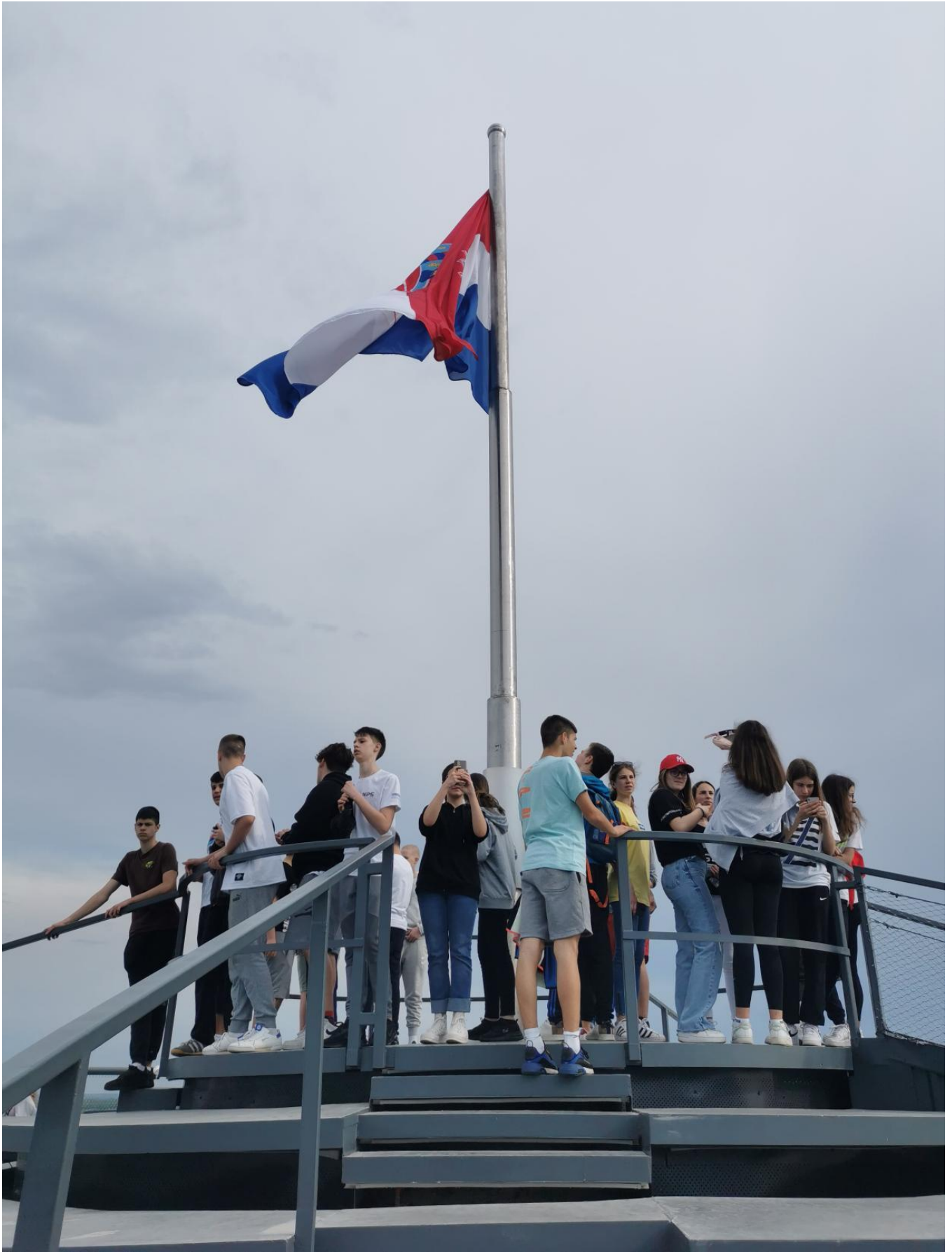
Osvojili smo Vodotoranj