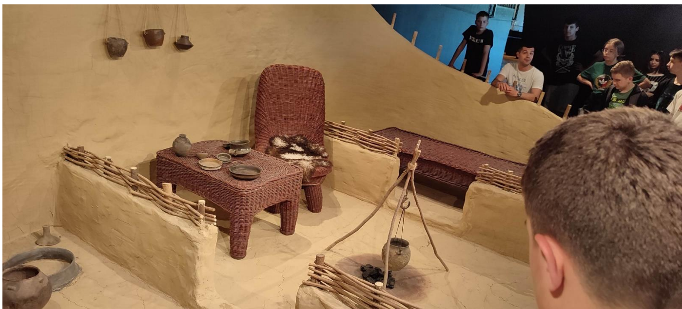
Zanimljiva priča o Vučedolu i Vučedolcima, životu, kulturi i običajima