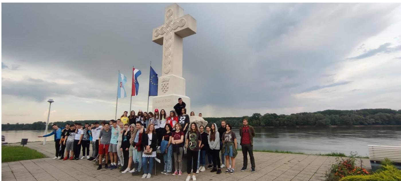
Križ na Vuki