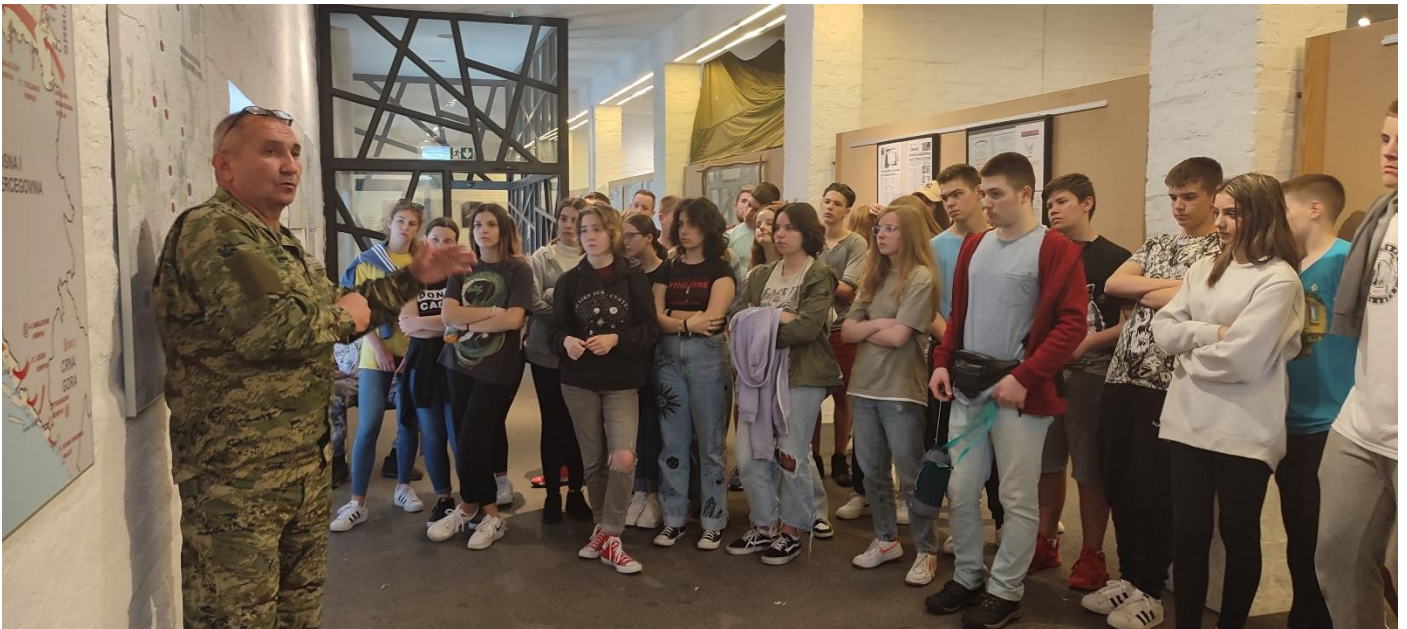
Obilazak uz stručno vodstvo