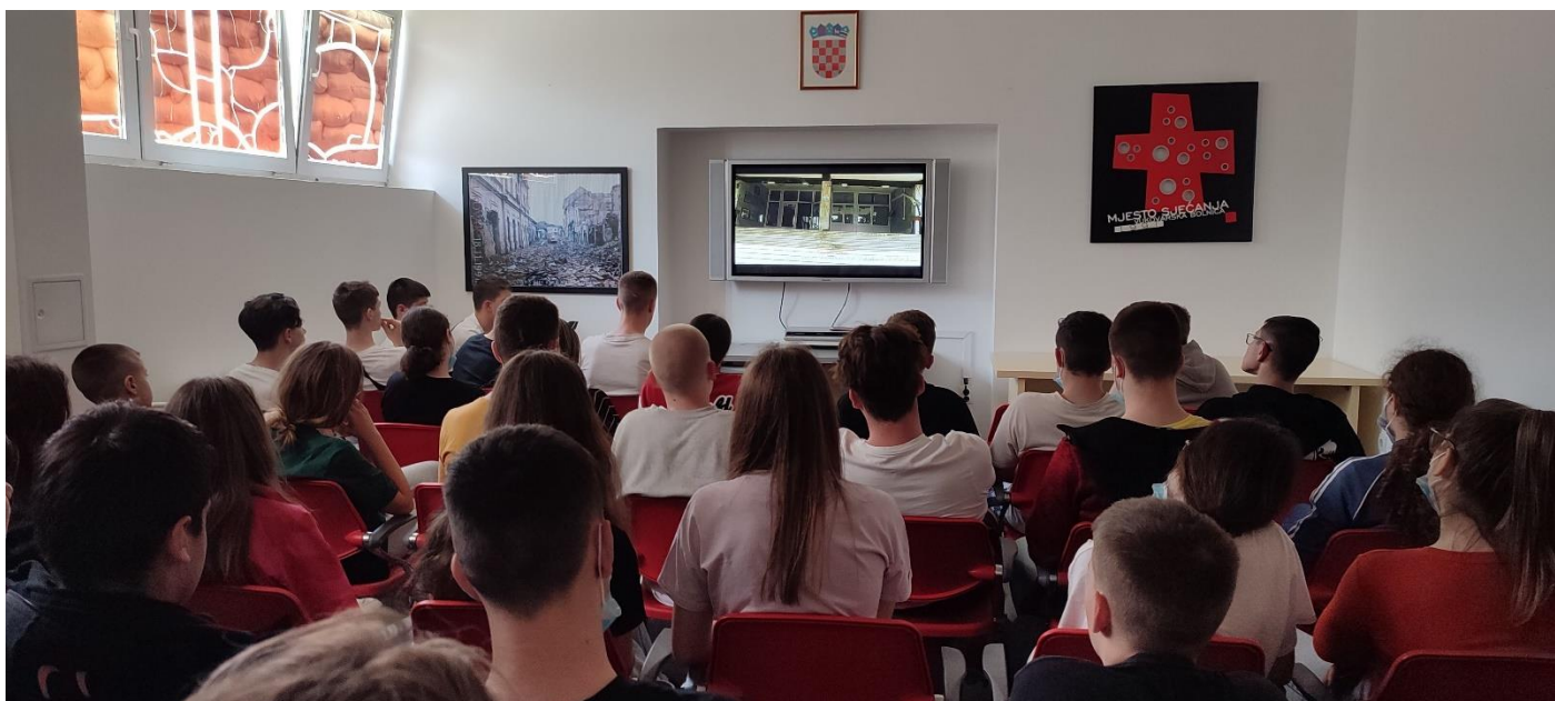
Potresno svjedočanstvo Vukovarske bolnice