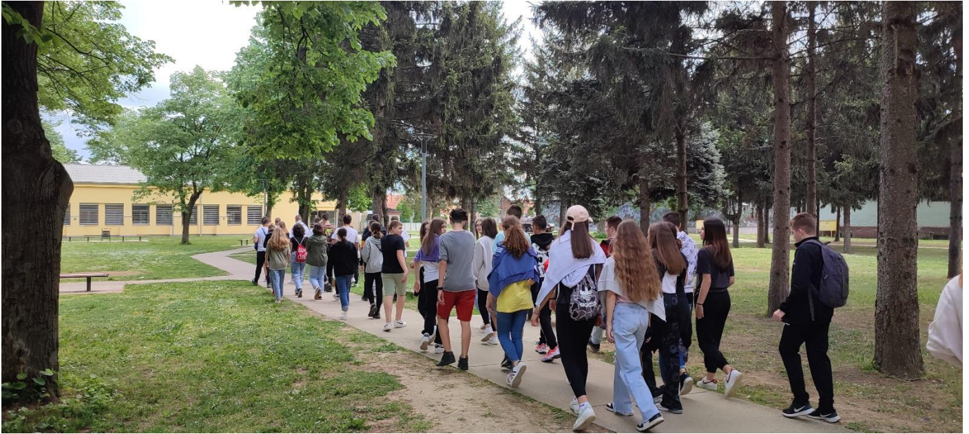
Memorijalni centar Domovinskog rata