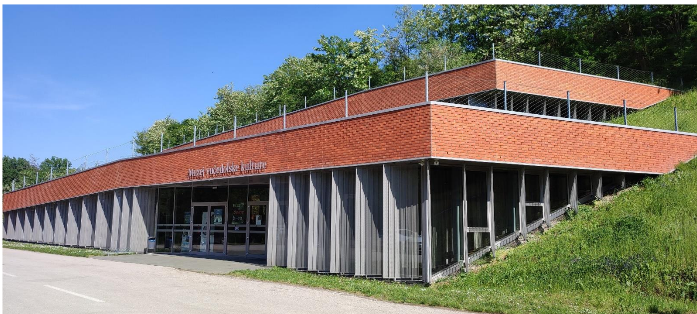
Muzej vučedolske kulture