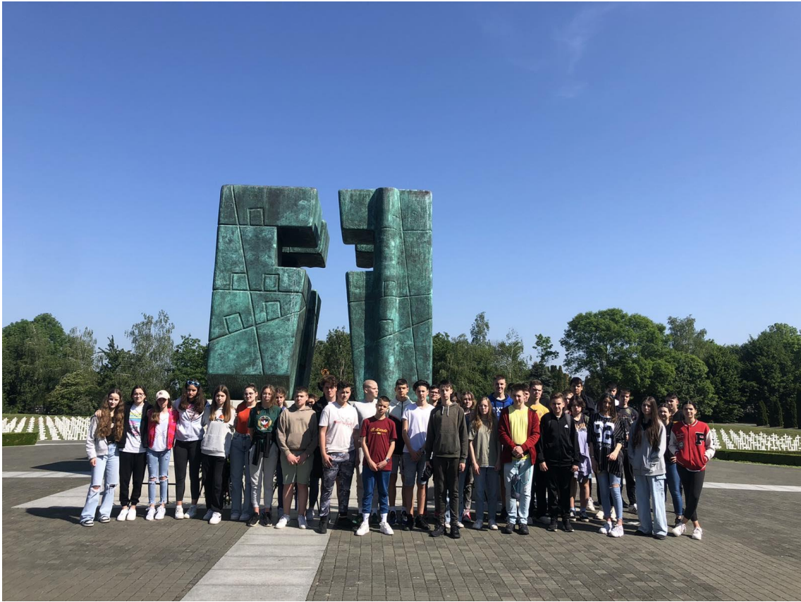
Na Memorijalnom groblju i Ovčari