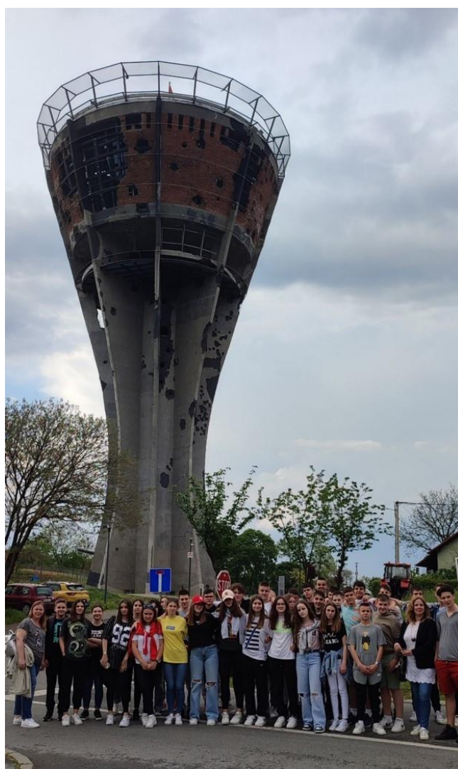
Vodotoranj – simbol otpora, hrabrosti i zajedništva