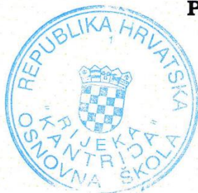
Sanja Kvaternik Hren